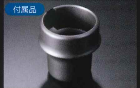
カップホルダー用アタッチメント