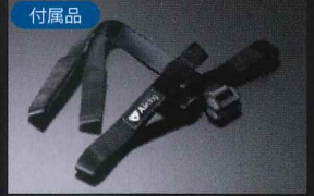
シート用アタッチメントベルト