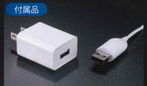
ACアダプタ&USBケーブル