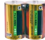
単一アルカリ乾電池(2本組)