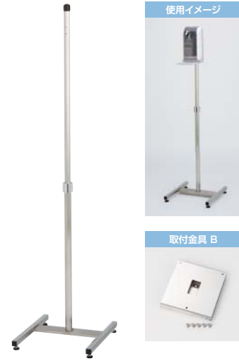
ディスペンサー用マルチスタンド